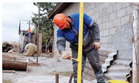
В РЕСПУБЛИКЕ УСКОРЯЮТ ТЕМПЫ ДОГАЗИФИКАЦИИ