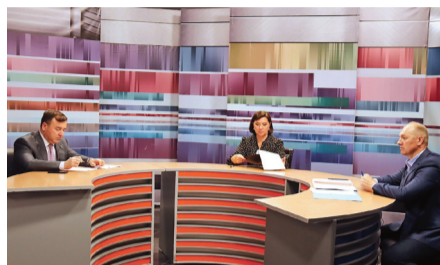
ПОДГОТОВКА К ХОЛОДНОМУ СЕЗОНУ ЗАВЕРШАЕТСЯ