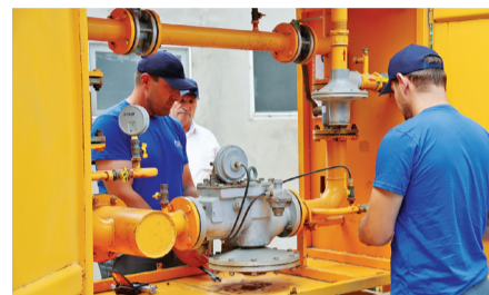
КЛЮЧ К КОМФОРТНОЙ ЖИЗНИ ДАГЕСТАНЦЕВ